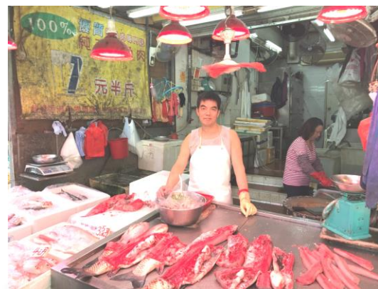
大埔富善街 72-74B 地下