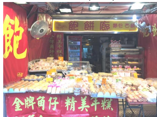
大埔富善街 52 號 D 地下