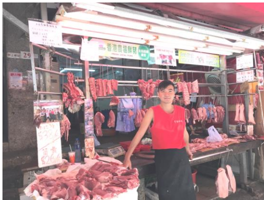
大埔富善街 29 號地下