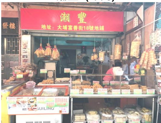
大埔富善街 18 號地下