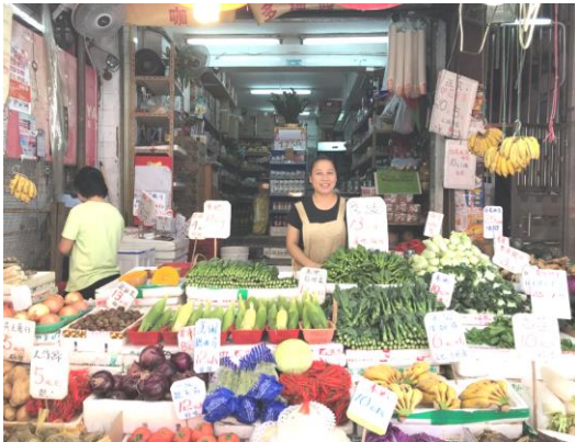
大埔富善街 63 號地下