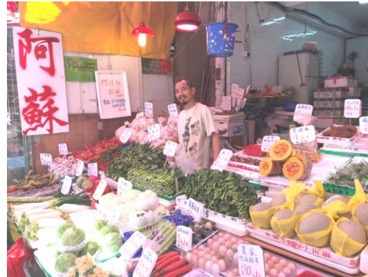
大埔富善街 59 號地下