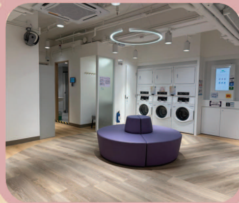
自助洗衣及乾衣機